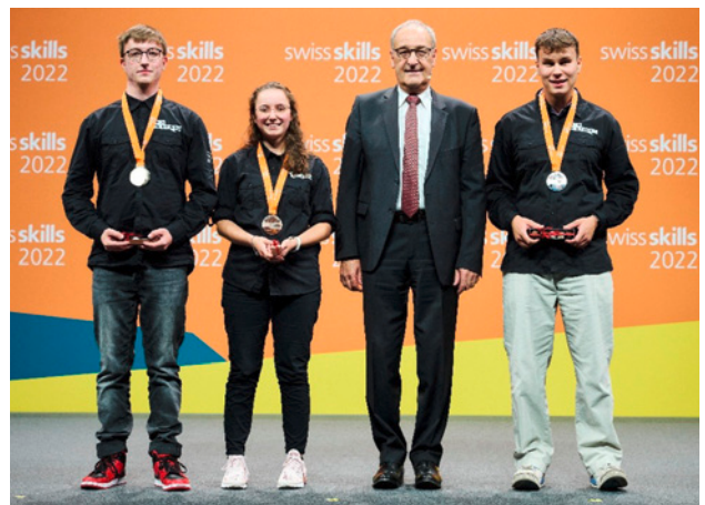
Die besten Gebäudetechnikplaner und -planerin Lüftung gemeinsam mit Bundesrat Guy Parmelin